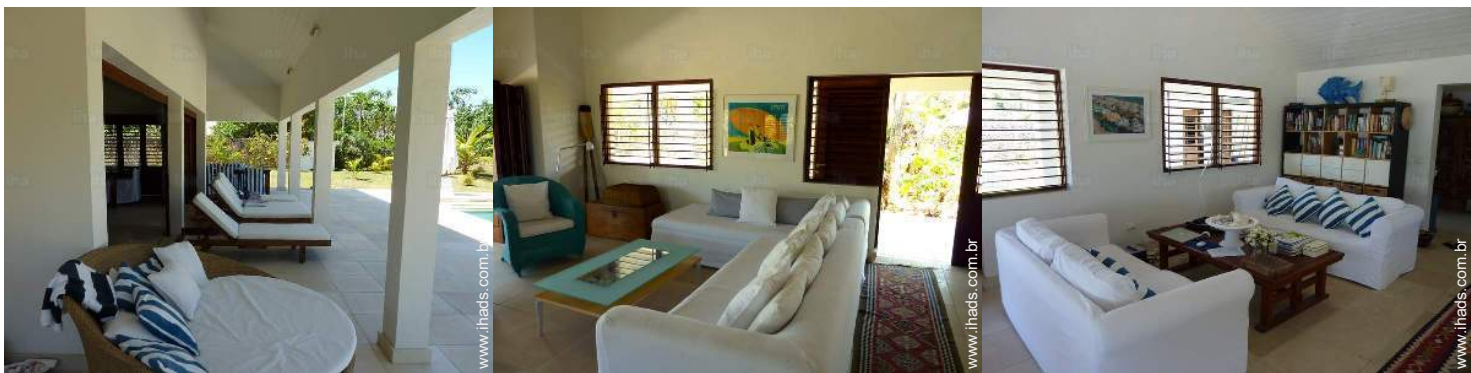
sala de estar