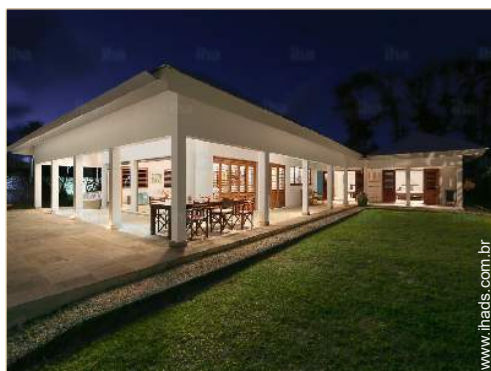
Vivenda de Luxo

Privilégios : Acesso directo à praia, praia privada, pista helicóptero