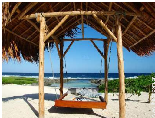
vista de mar