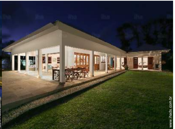
Vivenda de Luxo