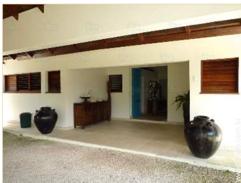
Vivenda de Luxo