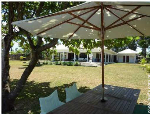
vista a partir do jardim/parque