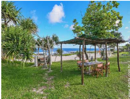
vista a partir do jardim/parque