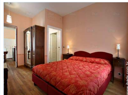
cama(s) de casal

Centro aldeia 300m Paragem/estação de autocarros 500m Aluguer bicicletas/BTT <50m Padaria 500m Pequenos comércios 500m Supermercado 500m Cabeleireiro 800m Correios 500m Banco 500m Farmácia 300m Médico 500m Hospital 7,5km