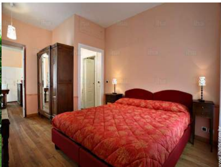
cama(s) de casal