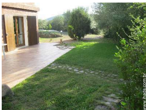
vista a partir do jardim/parque