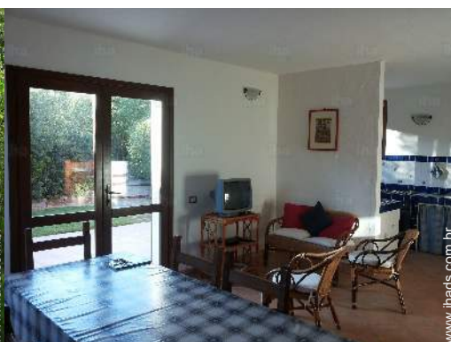
vista a partir da cozinha