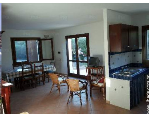
vista a partir da sala de estar