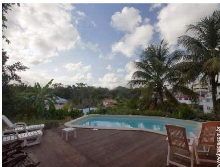
vista sobre piscina