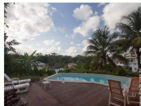
vista sobre piscina