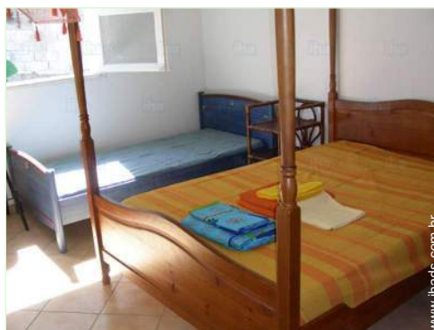
cama(s) de casal