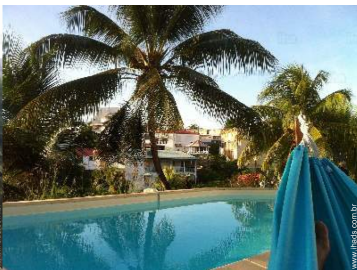
vista sobre piscina