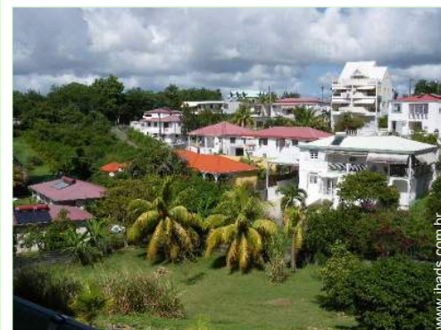
vista a partir do terraço