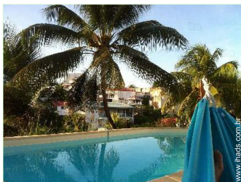
vista sobre piscina