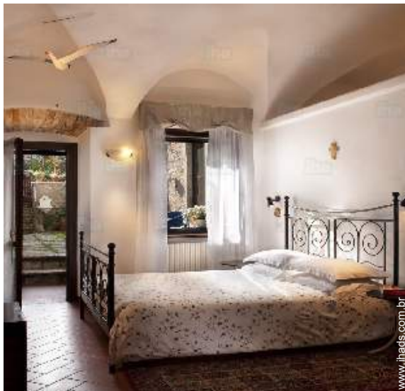
O quarto de hóspede