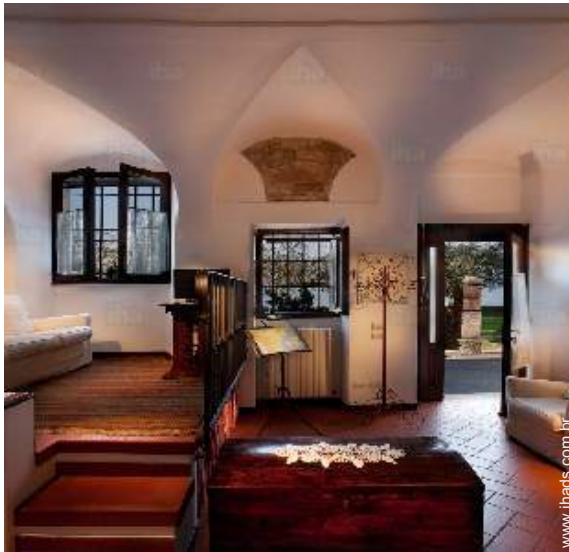
vista a partir da sala de estar