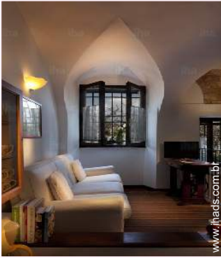
Divisões interiores à disposição dos hóspedes