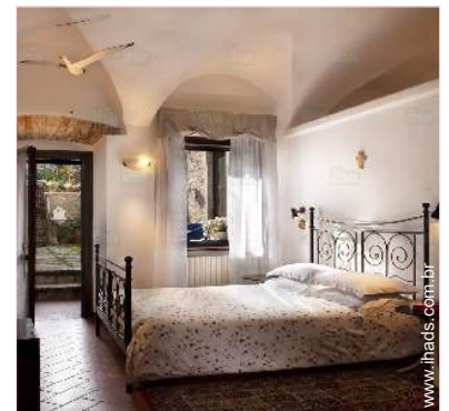
O quarto de hóspede